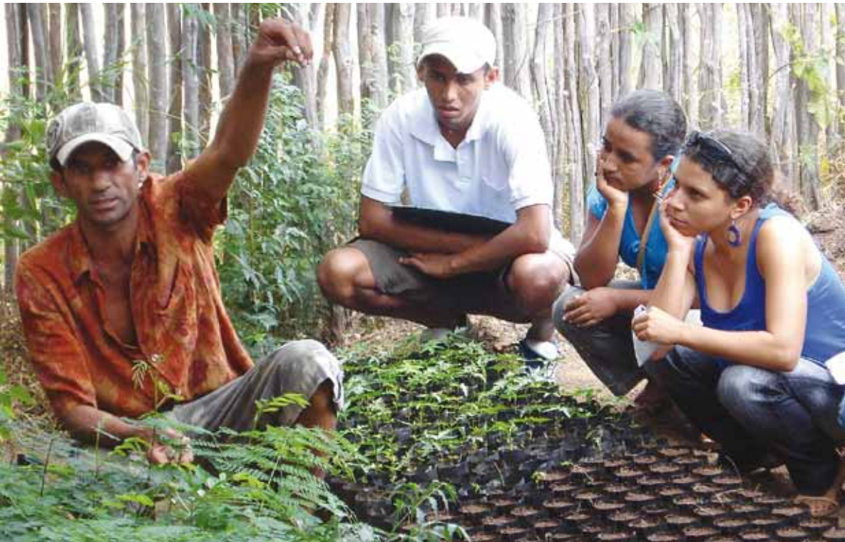
Ein Bauer unterrichtet Jugendliche bei der Nutzung einer Baumschule für einheimische Gewächse

die Bauern müssen nicht Arbeit in der Stadt suchen, um ihre Familien über das ganze Jahr ernähren zu können. In Vila Bela zum Beispiel blieben dank der nachhaltigen Waldwirtschaft alle Bauern im Ort, selbst als eine extreme Trockenheit 95 Prozent der Ernte vernichtete.