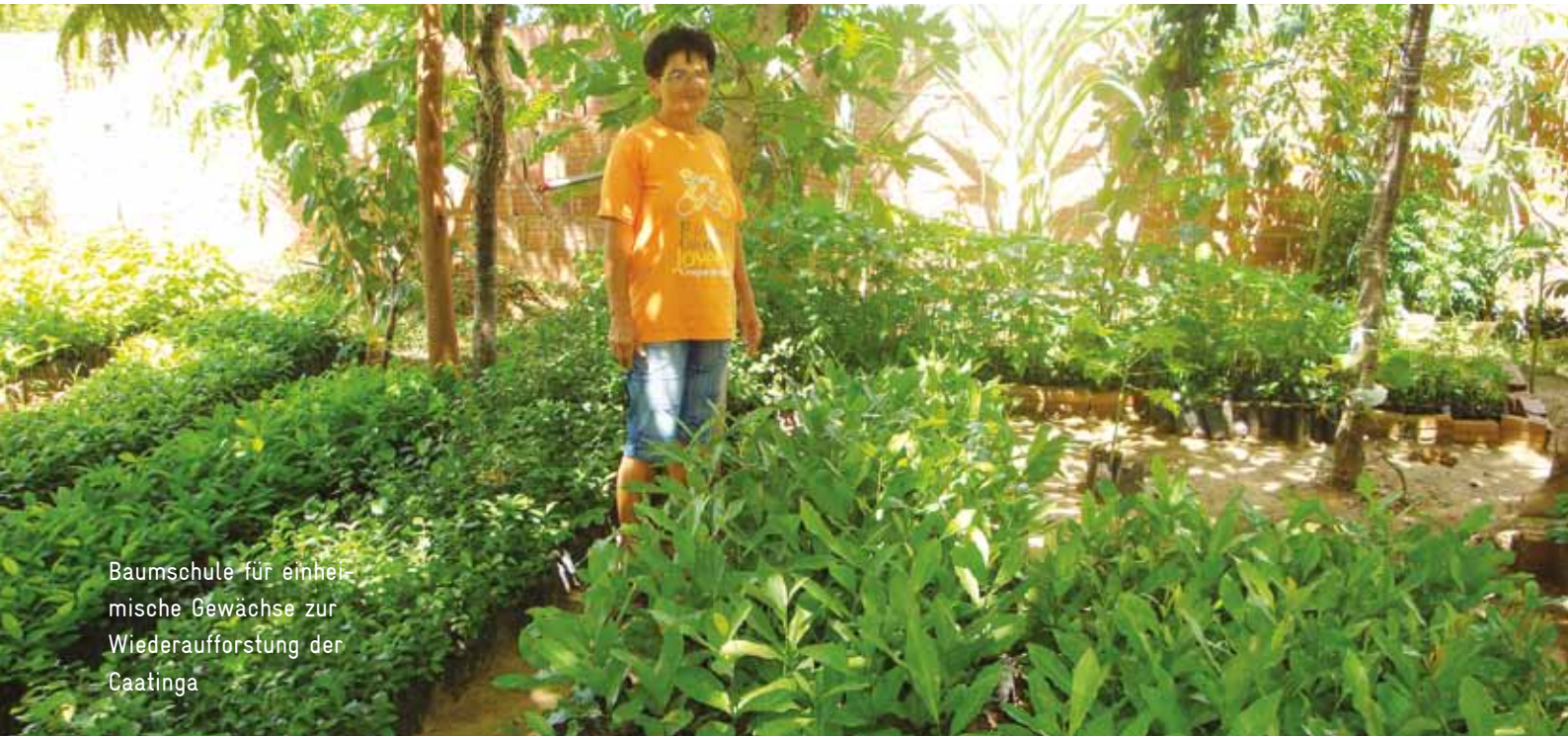
Baumschule für einheimische Gewächse zur Wiederaufforstung der Caatinga