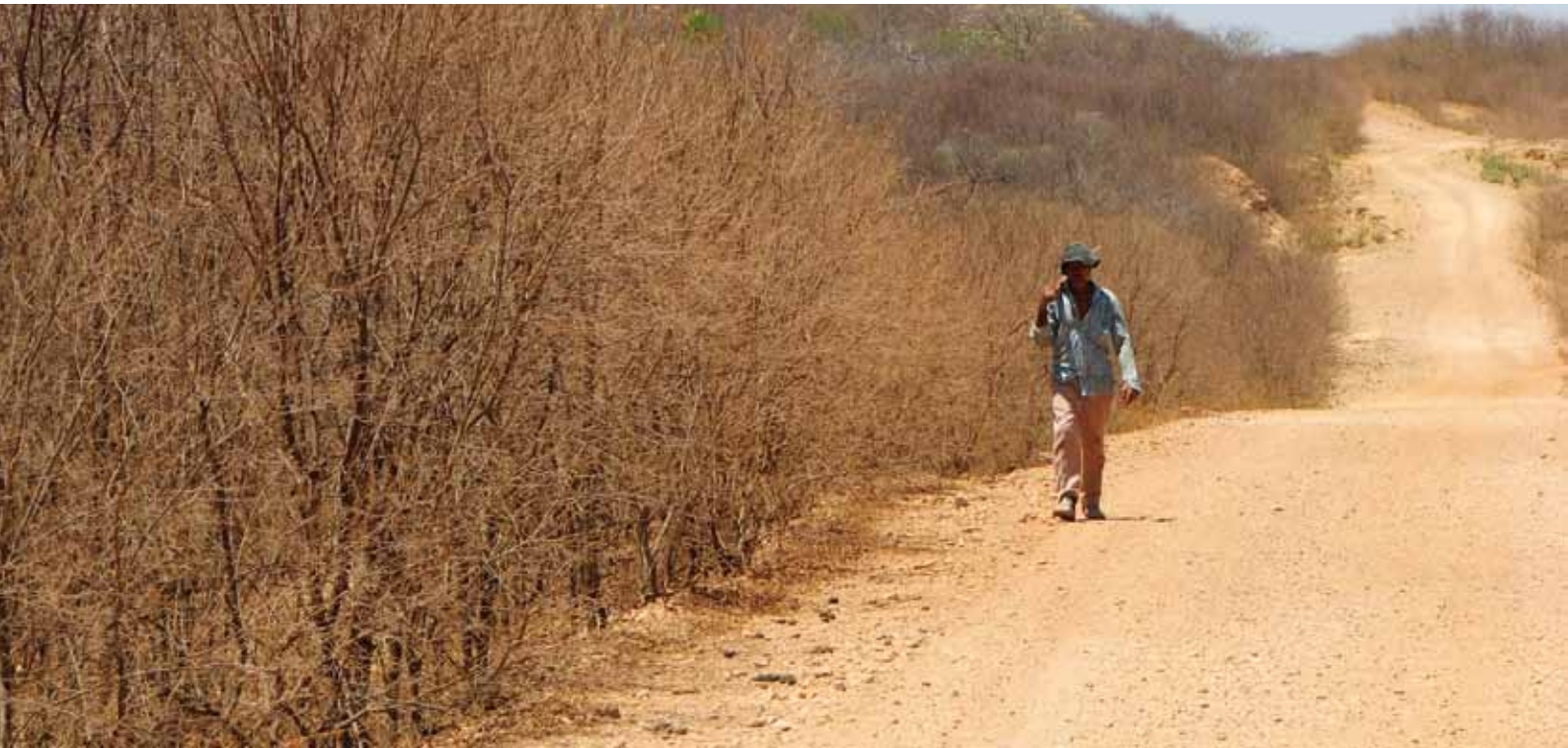
Caatinga in der Trockenzeit