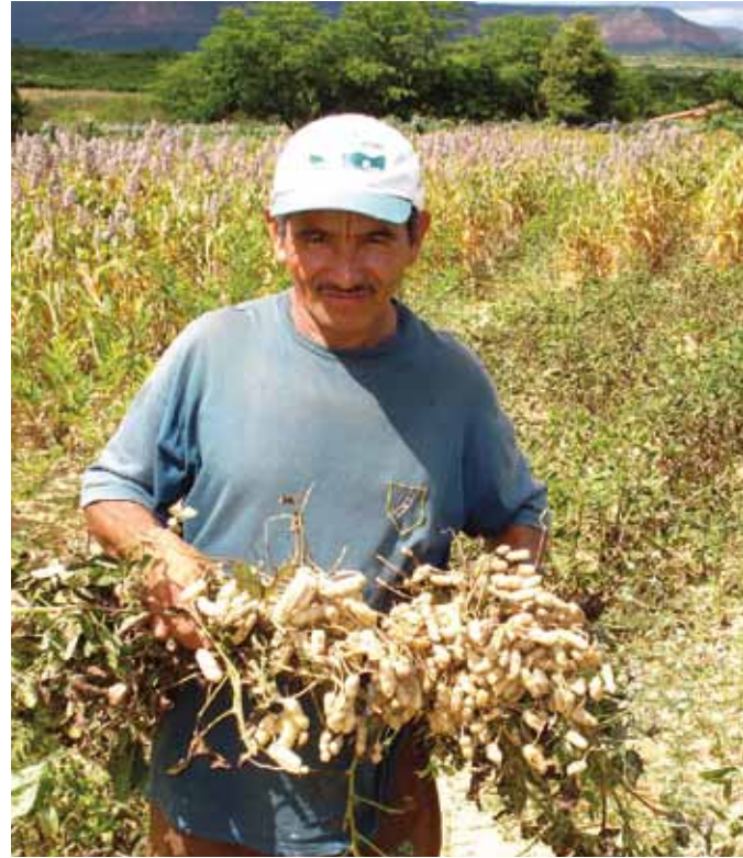
Mischkulturen in einer Trockenregion Pernambucos

Die Focal Points erarbeiteten außerdem mit dem Wirtschaftsforschungsinstitut IPECE einen Desertifikationsindex. Mit ihm können Entscheidungsträger den Handlungsbedarf in Interventionsgebiete-